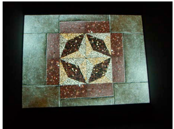
Image de la vidéo : une dalle du sol de l'Hôtel-Dieu.

« Cet ancien hôpital a été transformé en musée. Nous avons vu une vidéo sans le son : nous étions assis dans un cube blanc. Il y avait un jeu de mots sur hôtel et Hôtel-Dieu, l'hôpital et des vues d'un hôtel et d'un hôpital.