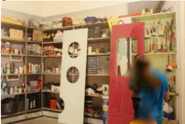
La maison et l'atelier : Photo groupe 2

« Aux Abattoirs, j'ai préféré le tableau de Picasso « La mort du Minotaure en costume d'Arlequin » avec le tableau de Dali et les sacs d'argent. »