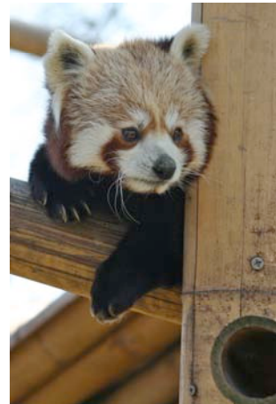
Christophe Eyquem. Petit panda. http://freemages.fr/

Les pandas géants sont des mammifères en voie de disparition en Chine. Ils sont protégés dans des réserves.