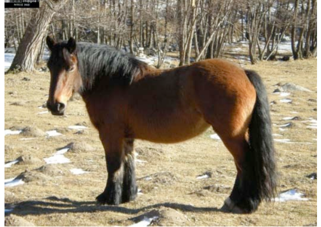
Site libre de droits Im@gine. Patrice Baud http://imagine.ac-montpellier.fr

Et sur le site Wikipedia. Fjord (cheval) http://fr.wikipedia.org/wiki/Fjord_%28cheval%29